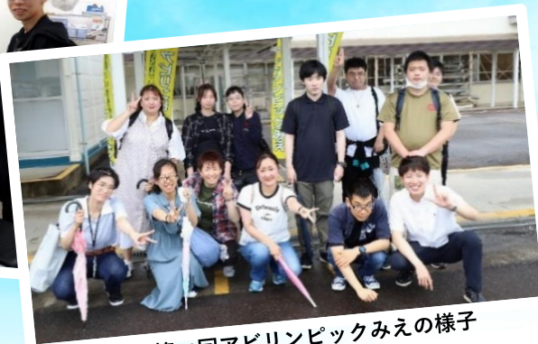
※第21回アビリンピックみえの様子

こん かい ひやくご ぎんこう とくれい こがいしゃ ひやくご かんり かぶしき かいしゃ 今回は、百五銀行の特例子会社である「百五管理サービス株式会社」にて、 まぎょう しゅつちやうばん かい さい れいわ ねん がつ にち かいはい 「企業出張版」として開催します。令和5年7月1日に開催された たい かい かい アビリンピックみえ かつやく せんしゅ まぎょう じつえん らん 「第21回アビリンピックみえ」にて活躍した選手の競技実演をご覧ください！