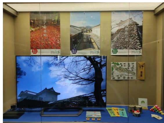
第4回検討会議 令和3(2021)年1月27日 亀山市紹介DVD上映(東京事務所内展示コーナー)