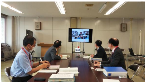
策定、公表に向けての協議 第2回検討会議 令和3(2021)年3月16日