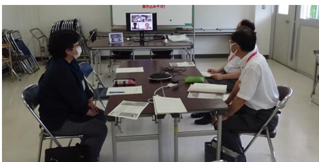
第2回検討会議（参集とオンライン参加の選択方式で実施）