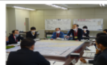
写真=図上訓練における検討(令和2年11月)

平成30年度:タイムラインに係る行動項目を抽出 令和元年度:タイムライン(案)を作成 令和2年度:図上訓練でタイムライン(案)を検証 ⇒桑員地域広域避難タイムライン完成