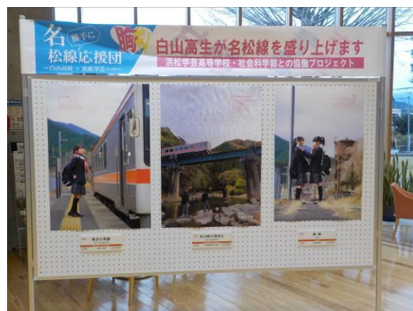
美杉総合支所 1 階ロビーでの 名松線の魅力 P R ポスター展示