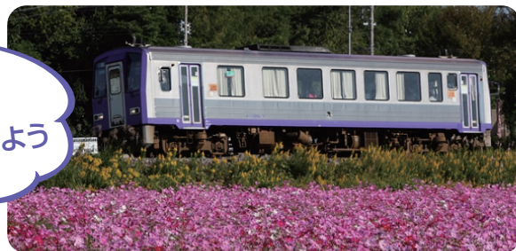
撮影地：亀山市 亀山～関