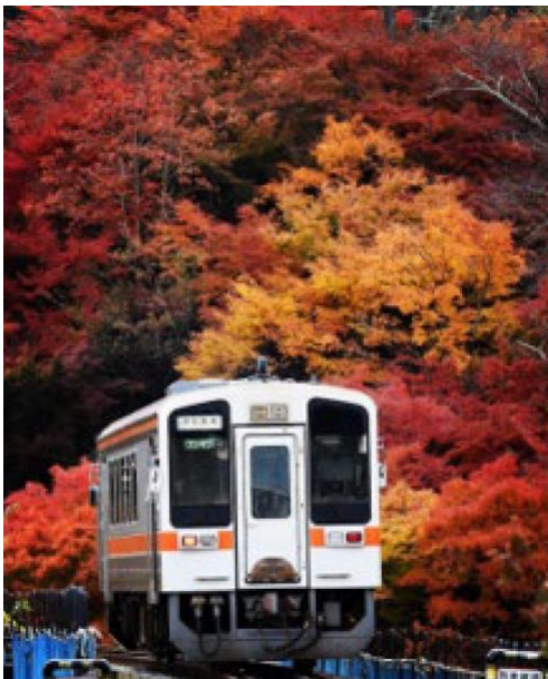
家城駅付近の紅葉（津市）masamituyamamoto 様