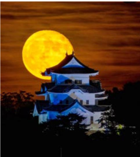
伊賀上野城（伊賀市）matujun2525 様