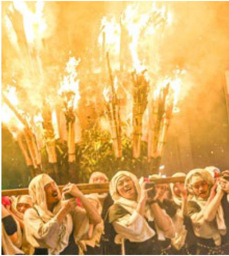
僧兵まつり（菰野町）mie_eetoko 様