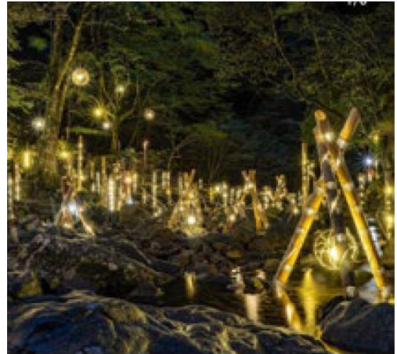
赤目四十八滝（名張市）sanpei_mie 様