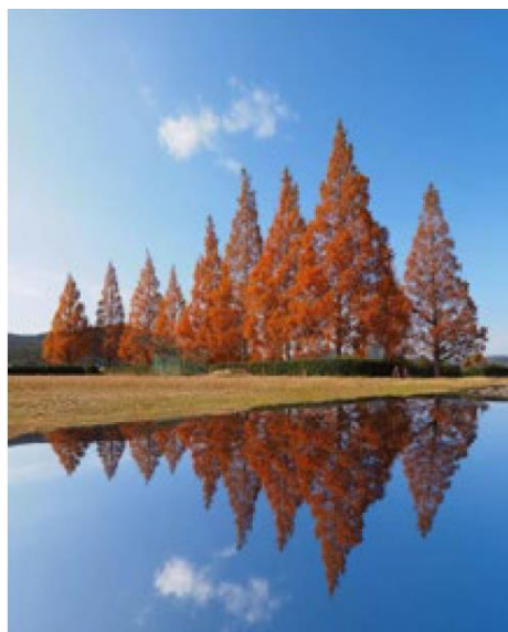
大山田せせらぎ運動公園（伊賀市）naosetu 様