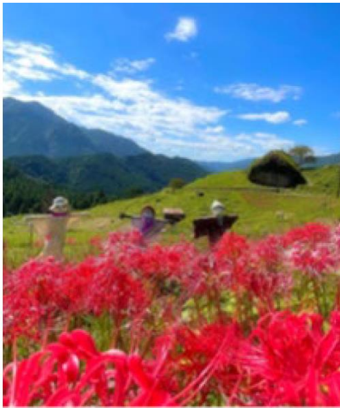
丸山千枚田（熊野市）aki_scenery 様