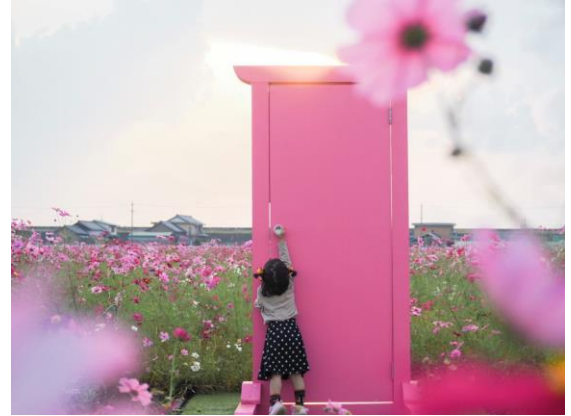
コスモス畑（木曾岬町）maico8o 様