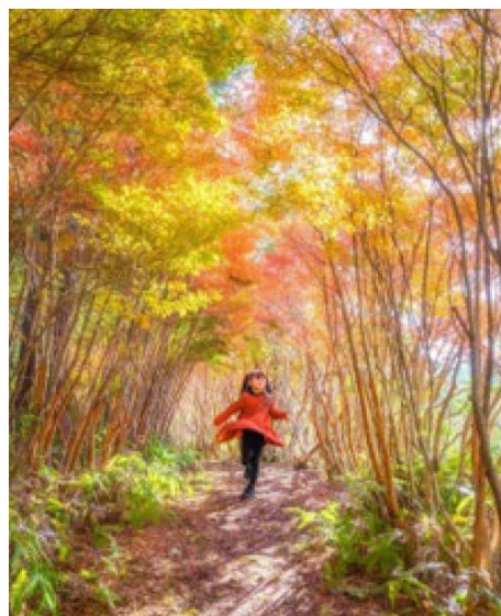
丸山公園（大台町）kyasunobu 様