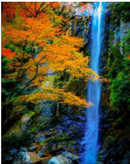
六十尋滝（大台町）hachibeiy 様