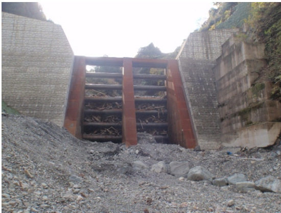
西之貝戸川砂防施設群（遠景）

青川（後谷川）土砂堆積状況（令和5年8月） 堆積土砂撤去状況（令和6年1月時点）