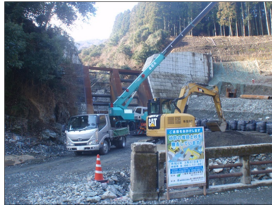
西之貝戸川砂防（4号えん堤嵩上工）工事