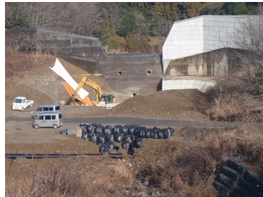
青川砂防（1号えん堤前庭保護工）工事