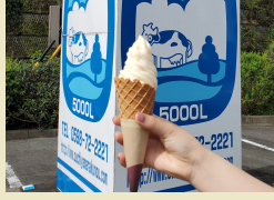
大内山ソフトクリーム (道の駅奥伊勢木つつ木館)