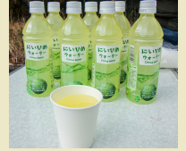
にいひめウォーター (奥伊勢フォレストピア)