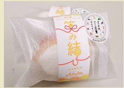
笑み結び (マイヤーレモンケーキ) (奥伊勢フォレストピア)

協力：奥伊勢フォレストピア、BOUQUET（ブーケ）、道の駅奥伊勢おおだい、カナエタ bread and coffee、kikicafe、道の駅飯高駅、深緑茶房、奥松阪、とときみそ（同）、つるや本店、わらしべ飯高駅前店、八十八屋、やきたて工房一休山、お食事処ほんだ、ふれあいの館、道の駅 奥伊勢木つつ木館、（一社）大紀町観光協会、阿曾温泉