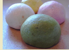
伊勢芋まんじゅう (ふれあいの館)