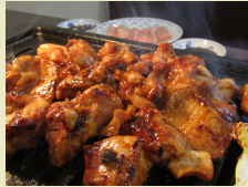
鳥焼き肉 (道の駅飯高駅)