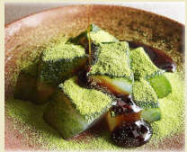
こんにゃくスイーツ (つるや本店)