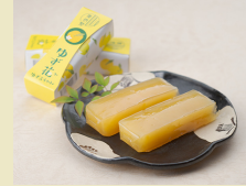
柚子の羊羹 (道の駅奥伊勢おおだい)