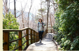
北総門山展望台 ミニハイク (1km)