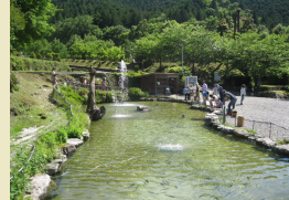
ニジマス釣り & 塩焼き体験