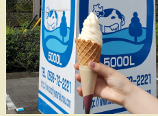
大内山ソフトクリーム (道の駅奥伊勢木つつ木館)