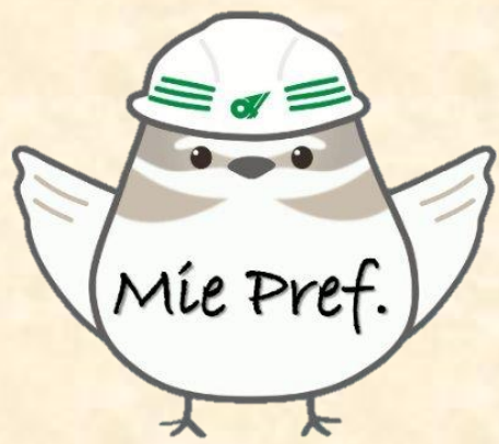
三重県土木整備部マスコット ちどりん