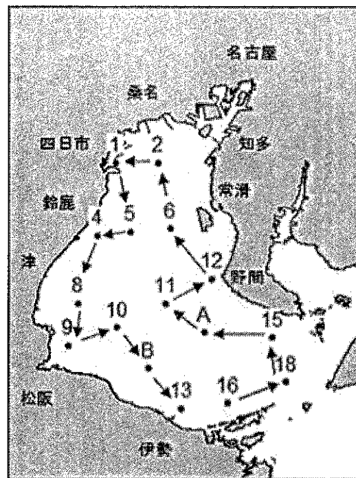
浅海定線観測点及び航跡図