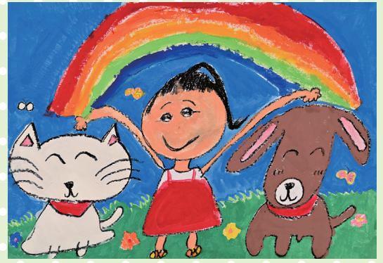
令和5年度動物愛護の絵・ポスター 小学校低学年の部 三重県知事賞