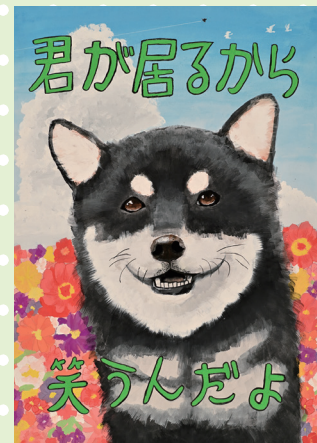
令和5年度動物愛護の絵・ポスター 中学校の部 三重県愛玩動物協会賞