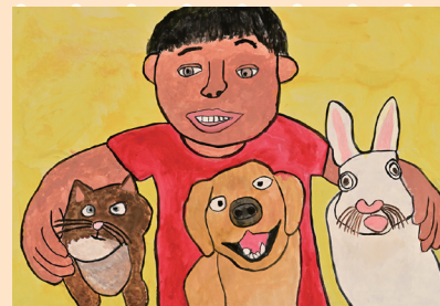
令和5年度動物愛護の絵・ポスター 小学校低学年の部 あすまいる賞