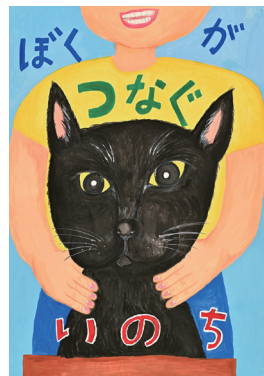
令和5年度動物愛護の絵・ポスター 小学校高学年の部 三重県獣医師会長賞

犬や猫の放し飼いや鳴き声、ふん尿などの苦情が保健所に多く寄せられます。飼い主としてのルールとマナーを守り、地域で受け入れられるように飼うことが社会に対する責任です。