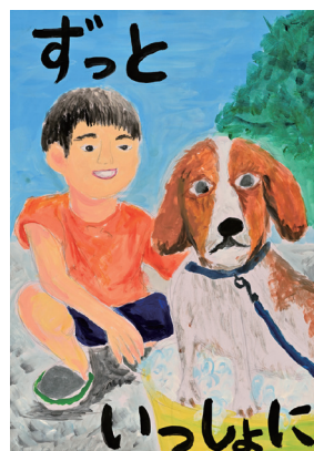
令和5年度動物愛護の絵・ポスター 小学校高学年の部 あすまいる賞

人の食べ物の中には、ペットが食べると健康に悪影響を与えるものがあります。その他、玩具、タバコの煙や殺虫剤などの化学薬品にも注意してください。