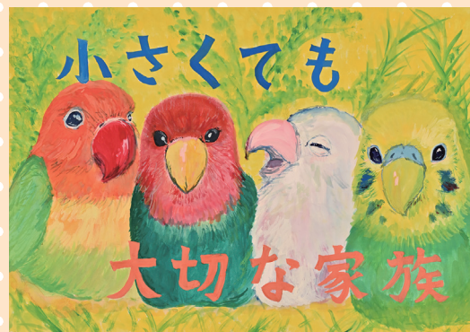
令和5年度動物愛護の絵・ポスター 中学校の部 三重県知事賞