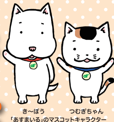
き〜ぼう つむぎちゃん 「あすまいる」のマスコットキャラクター