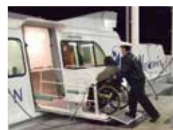
高速船への乗船のようす