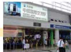
名鉄中部国際空港駅