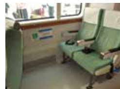
高速船内車いす対応座席