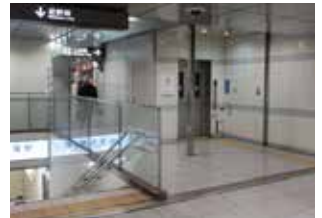
近鉄名古屋駅へ下りるエレベーター

新幹線は 14～17 番ホームに到着。8 号車付近にあるエレベーターで北口改札へ下りる。北口改札を出たら左折し、中央コンコースを桜通口方面へ約 100m 進む。正面にタカシマヤのエスカレーターと「金の時計」が現れたらその手前を右折し、広小路口方面へ。約 80m 進むと通路左側に「名古屋マリオットアソシアホテル」の入口があり、通路右側の奥に近鉄名古屋駅へ下りるエレベーターがある。