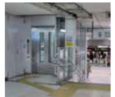
桜通口改札エレベーター

JR 桜通口改札を出て右折し、約 30m 進むと中央コンコースに出る。そのまま直進し、広小路口方面へ。約 80m 進むと通路左側に「名古屋マリオットアソシアホテル」の入口があり、通路右側の奥に近鉄名古屋駅へ下りるエレベーターがある。