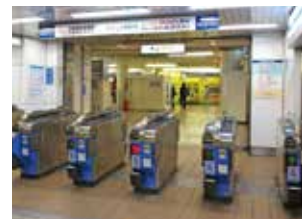
名鉄→近鉄のりかえ口

名鉄 1 番ホームの中ほどにある「近鉄線のりかえ口」を目指す。2～4 番ホームに到着した場合は、まずエレベーターで改札階へ上がり、西改札口のエレベーターで 1 番ホームへ下りる。西改札口手前の階段は約 15m のスロープで解消されている。エレベーターを降りたら右折すれば、近鉄線のりかえ口に出る。