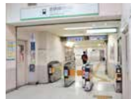
近鉄鶴橋駅西口改札

新大阪駅から地下鉄御堂筋線でなんば駅へ行き、近鉄大阪難波駅へ乗換える方法もある。駅構内を移動できるので雨の日などは便利だが、鶴橋駅で乗り換える方が歩く距離が少ない。