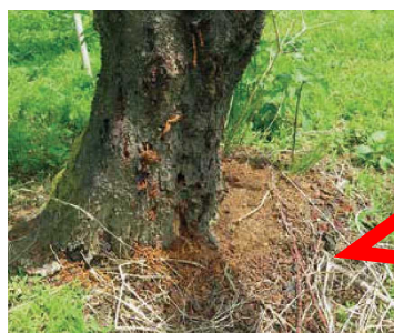
クビアカツヤカミキリのフラス