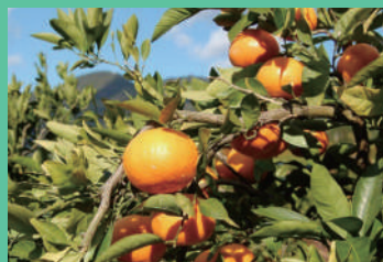
すぎもと農園/2日目