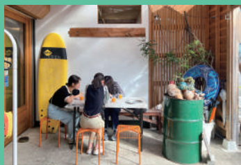
アタシカデイズ/1日目

今回訪れる東紀州は、東に広がる太平洋の大海原と、西に連なる紀伊山地の山々に抱かれた、豊かな自然のエリアです。ブランドヒノキで知られる林業や、温暖な気候を活かした柑橘農業も盛んに行われています。近年は世界遺産・熊野古道が注目を集め、海外からの観光客も増えてきました。そんな歴史や自然に育まれた暮らしと仕事を、五感で感じていただけるのが今回のバスツアー。1泊2日で巡る訪問先の行程をご紹介します。