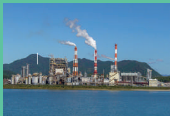
北越コーポレーション紀州工場/1日目