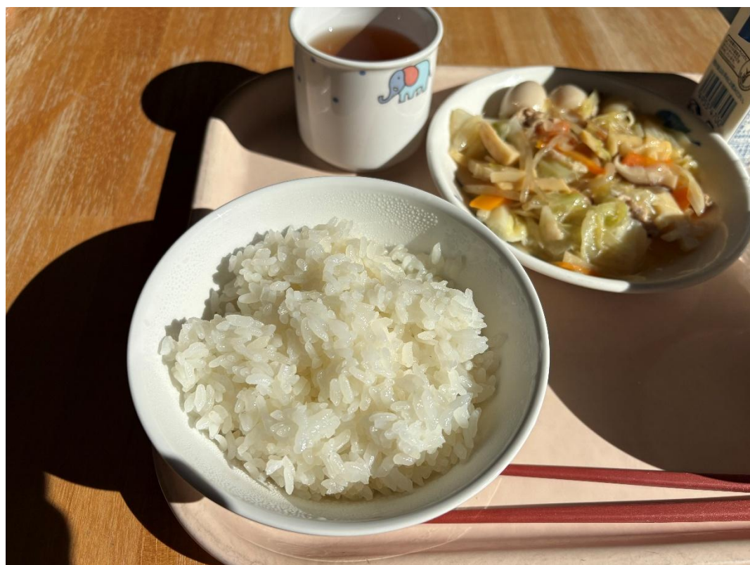
写真2 : 丸山千枚田のお米