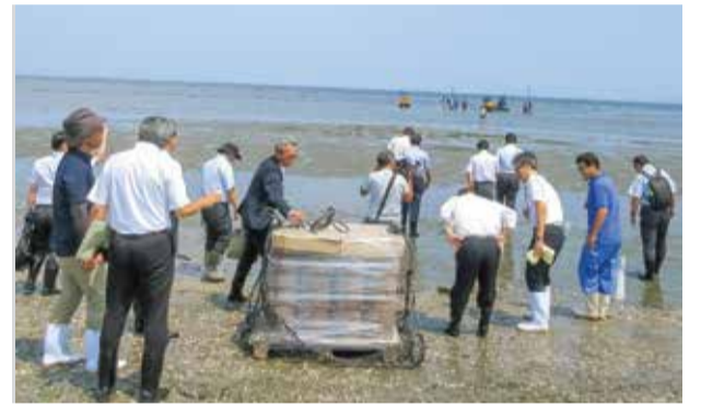
黒ノリの色落ち対策の調査（伊勢市）

これらの調査から得られた知見を生かし、豊かで美しい三重の海が次世代へ引き継がれていくことを目指して、特別委員会として独自の政策提言を取りまとめました。