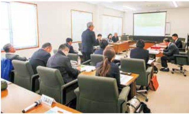
「新城市若者議会」について調査（愛知県）

また、愛知県の新城市役所を訪問し、「新城市若者議会」について調査を行いました。この「新城市若者議会」は、予算提案権を持ち、若者自らが予算の使い道を考え、政策立案しています。本県の県民提案予算とは異なる住民参加型の予算について調査し、県の予算審議等に生かしています。