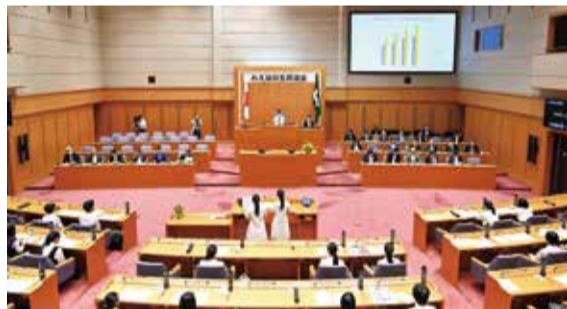
前回（令和6年度）の様子