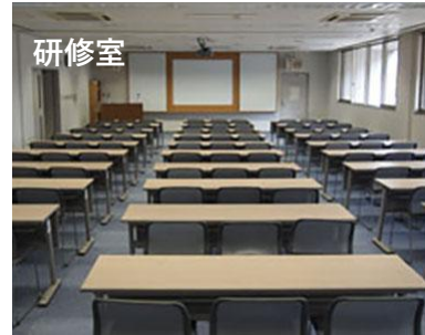
研修室 全室：座席数72人まで 3分の2室：座席数48人まで 3分の1室：座席数24人まで 設備：プロジェクター、常設スクリーン、マイク式