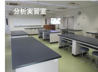
分析実習室 座席数48人まで 設備：モニター、マイク式、水道