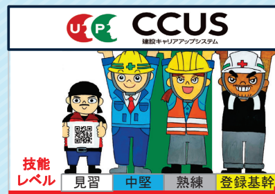
小規模企業への導入促進!

小規模な建設企業での導入が遅れているため、企業向け説明会の開催や市町に制度導入の働きかけ等を行うとともに、改正建設業法による適正な労務費の確保と賃金の行き渡り等の取組を行います。