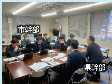
市町・民間へ取組促進!

県発注工事においては達成率がほぼ100%に達しており、引き続き取組を継続していきます。建設業全体への定着のため、市町工事・民間工事へ週休2日制をより一層促進します。