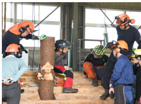
講座の様子（伐倒技術）

みえ森林・林業アカデミーでは、森林、林業、木材産業、または、地域社会等において、さまざまな課題に自ら取り組み、それぞれの分野をけん引する人材を育成するための取組を行っています。