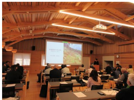
受講生が自ら企画したプロジェクトを発表