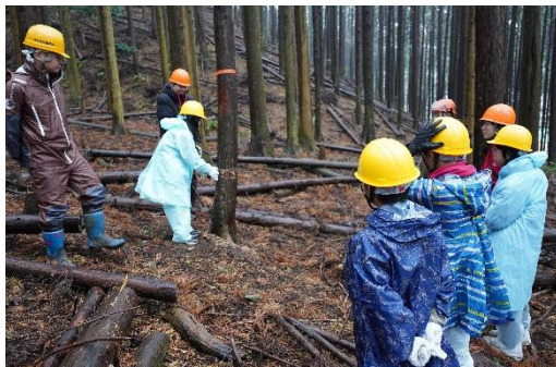
ジュニアフォレスター育成講座