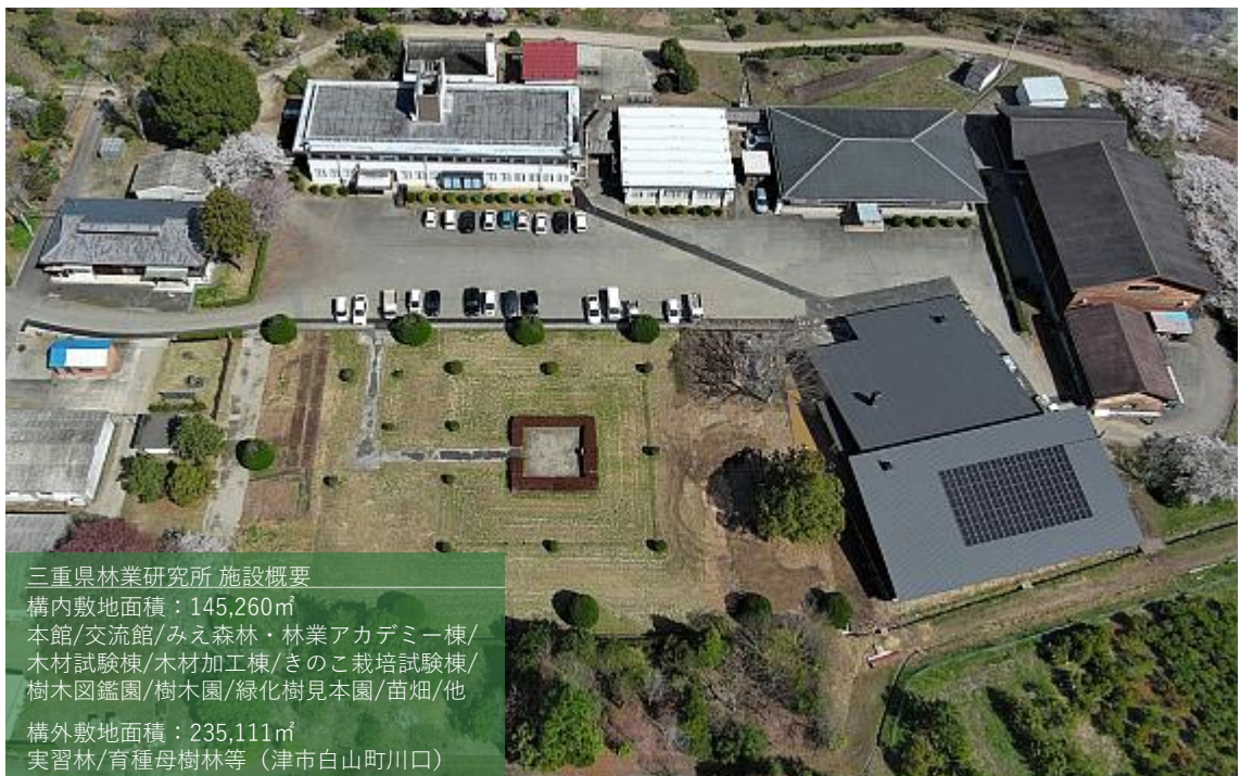
三重県林業研究所 施設概要