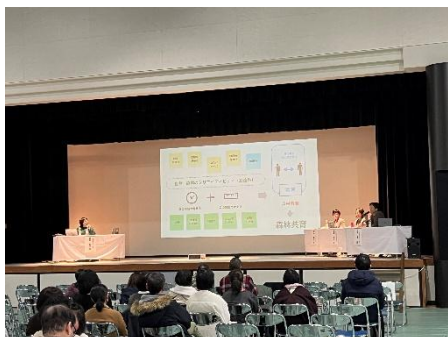
第4回みえ森林教育シンポジウム・ トークセッション

森林所有者等に対し、林業に関する技術及び知識の普及に取り組んでいます。また、「みえ森林教育ビジョン」を実現するため、年代別の森林教育プログラムの作成や各種講座、シンポジウムの開催に取り組むとともに、「みえ森づくりサポートセンター」の運営を通じた指導者の育成や森林教育のコーディネート、市町等からの相談対応などの取組を行っています。