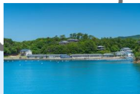
▲ミキモト真珠養殖場