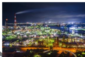
▲四日市コンビナート