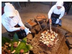
▲海女小屋はちまんかまど