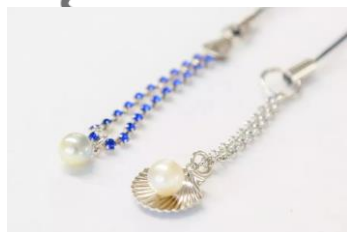
▲真珠工房 真珠の里

○おかげ横丁 【営業時間・定休日】午前9時～午後5時 ※時期、店舗により異なる 【駐車場】乗用車、大型車とも有り(伊勢神宮駐車場)