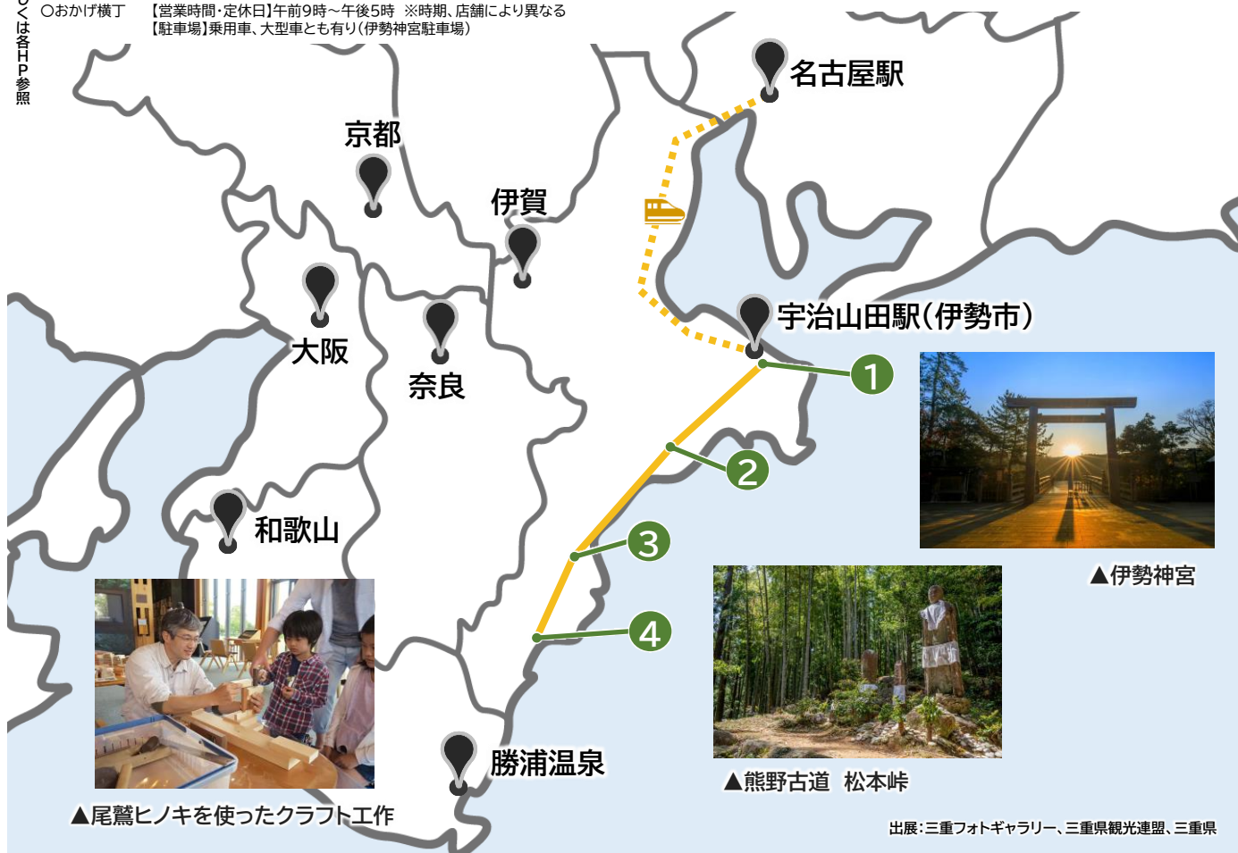
▲尾鷲ヒノキを使ったクラフト工作