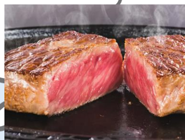
▲松阪まるよしの松坂牛