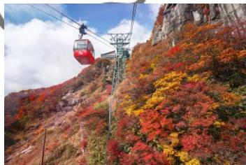
▲御在所ロープウェイ

○アクアイグニス 【営業時間、定休日】店舗によって異なる 【入場料】基本無料、体験・入浴等は別料金 【駐車場】乗用車、大型車とも有り ○ジャズドリーム長島 【営業時間、定休日】店舗によって異なる 【駐車場】乗用車、大型車とも有り