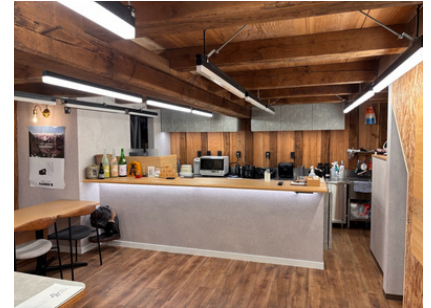
酒蔵を改装したサクラガワカモスクエア

おぐマルの大きな特徴は、単なる人手不足の解消にとどまらず、若者の「自分らしい生き方」やキャリア形成を支援する点にあります。職員は3ヶ月ごとに異なる業種を経験したりして地域との繋がりを広げ、将来的な起業や事業承継の足掛かりとしてこの仕組みを活用しています。地域おこし協力隊の卒業生が中心となって立ち上げたこの試みは、新しい人の流れを定着へと繋げる、過疎地域の新たな社会基盤となっています。