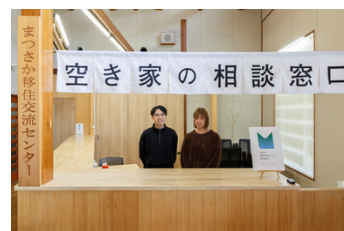
松阪市香肌地域づくり協同組合

松阪市の飯南・飯高地域を拠点とする「松阪市香肌地域づくり協同組合」は、地域の担い手確保と移住促進に取り組む組織です。農業や林業、宿泊業など19の事業者が加盟しており、職員が複数の職場を経験しながら、年間を通じて安定して働ける環境を提供しています。併せて空き家バンクの運営等も市から受託しており、仕事と住まいの双方を整えることで地域で暮らしたいと考える人々の歩みを支えています。