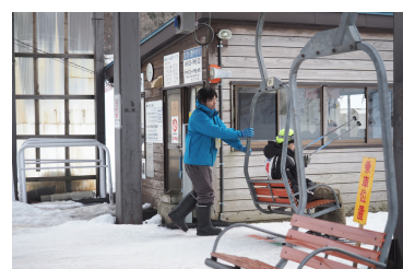
小国で働くマルチワーカー