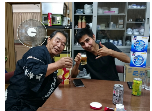
国際ワークキャンプの様子

※国際ワークキャンプ…「世界中から集まったボランティア達が共に暮らしながら、住民の方々と共に活動する「合宿型のボランティア」のことです。日本を含め、約70ヶ国で年間3,000回で開催されています。」 （国際ボランティアNGO「NICE」のWEBページより）