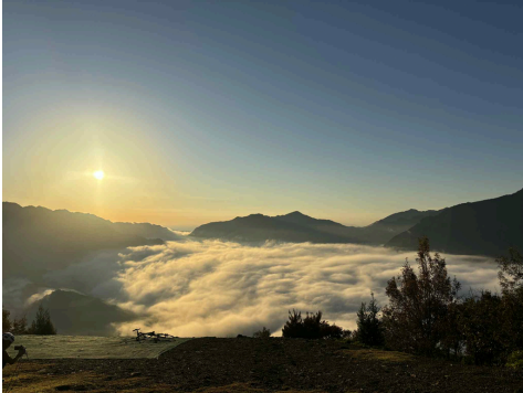
赤木城と雲海