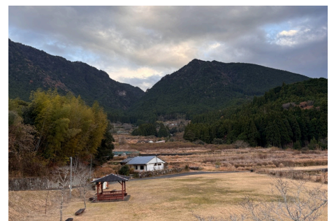
赤木城から集落を望む

しかし、持続可能性の観点では深刻な課題も浮き彫りになっています。特にシカやクマによる鳥獣被害は、農業継続の意欲を削ぐ最大の要因となっており、耕作を断念する住民が後を絶ちません。また高齢化に伴い、地域のアイデンティティである盆踊りや共同作業の維持が困難になるなど、コミュニティ機能の低下が進んでいるのが現状です。市が掲げる「自助・互助・公助」の理念において、公的支援がどこまで介入できるかという問いに対し、今後は従来の「維持」だけでなく、移住者や関係人口を交えた「新しい互助」の形を戦略的に構築していくことを考える時期に来ているのかもしれません。