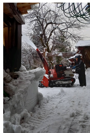
除雪作業