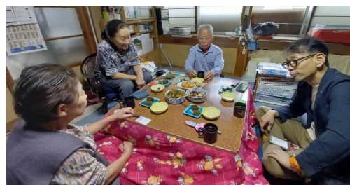
「茶飲み」は長い冬の楽しみの一つ

一方で、集落の維持には住民による共同作業がやはり今も欠かせません。西横山では「結（ゆい）」の精神に基づき、そして側溝清掃や神社の掃除などに町内会費から日当を出すなどの工夫もしながら継続されています。中ノ俣では限られた人口の中でも「自分たちで何とかしよう」という強い意志を持ち、市内外の人々と交流を重ね、農業や景観を維持する取組を積極的に行っています。中ノ俣の人々は、人と自然が「共に生きる」知恵を大切にしています。しかし、将来への懸念は依然として深刻です。耕作効率の悪い農地は次第に放置され、林野へと姿を変えつつあります。中ノ俣のように危機感を持って対策を講じる動きがある一方で、10年後の集落の姿に対する不安や、小学校の存続を巡る地域内の意識の温度差など、周辺の数多くの地域をも含め解決すべき課題も多く残されています。行政による公助も行き届いていますが、住民は「まずは自分たちの力で何とかする」という自立の意識を持ちながら、コミュニティの限界と向き合っている状況にあります。