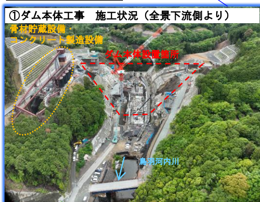
①ダム本体工事 施工状況 (全景下流側より)