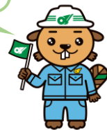
ダム班イメージキャラクター「カイルくん」